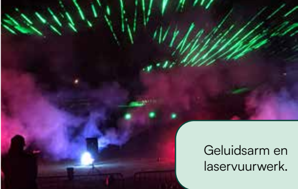
Geluidsarm en laservuurwerk.