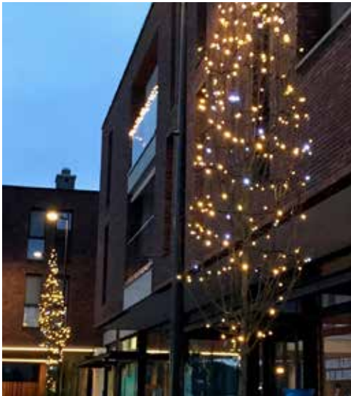
Sfeervolle kerstverlichting in onze centra.