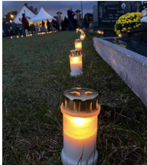
Reveil met Allerheiligen.