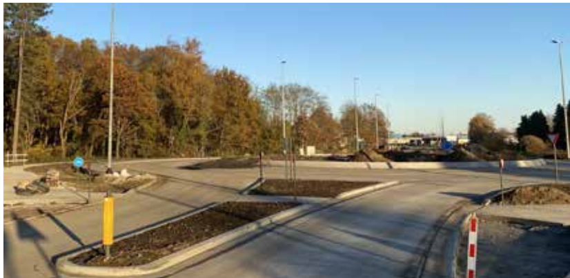
Herinrichting parkeerplaatsen GBS De Puzzel en Pleintje en vernieuwing toegangsweg parochiezaal Begijnendijk.