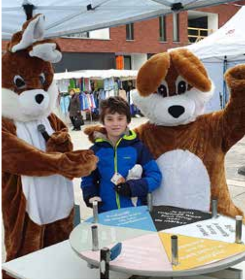
Randanimatie bij de nieuwe markt.