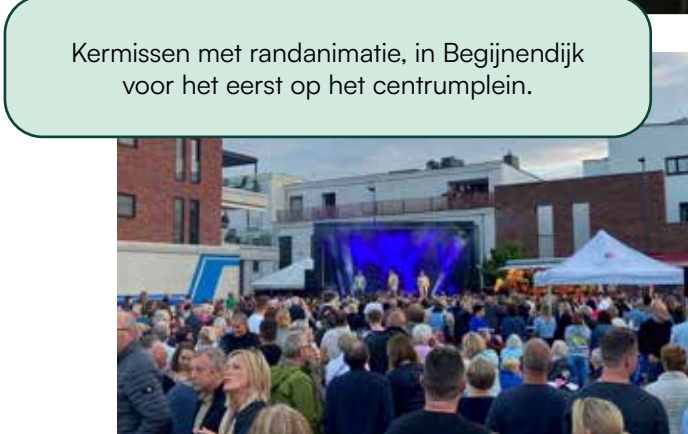
Kermissen met randanimatie, in Begijnendijk voor het eerst op het centrumplein.