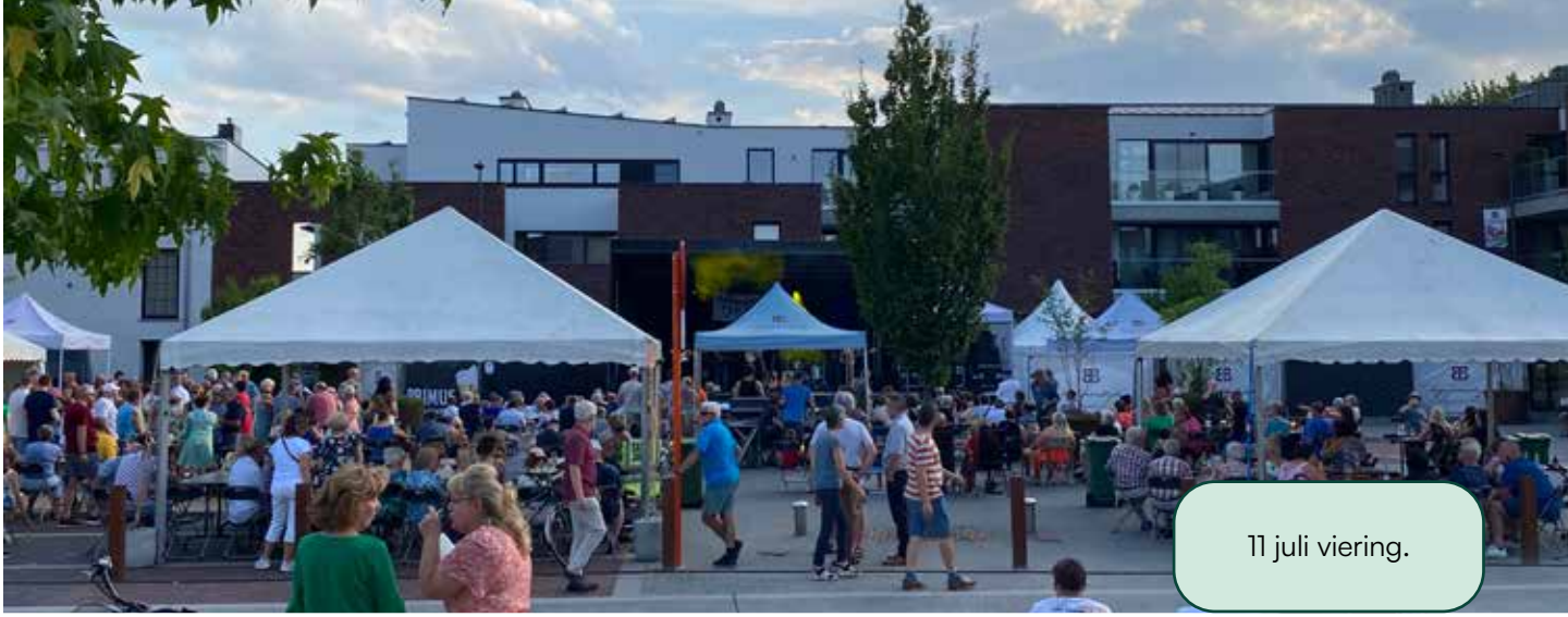
11 juli viering.