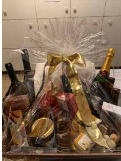
Voor de jubilarissen en 100-jarigen wordt er door het bestuur een geschenkmant overhandigd.